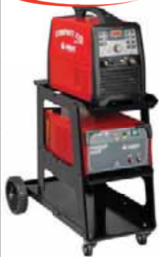
Water cooler 99490015 Trolley 99900154