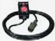
Optional code 99810014 Manual Remote Control