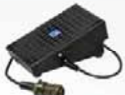
Optional code 99810015 Foot Remote Control